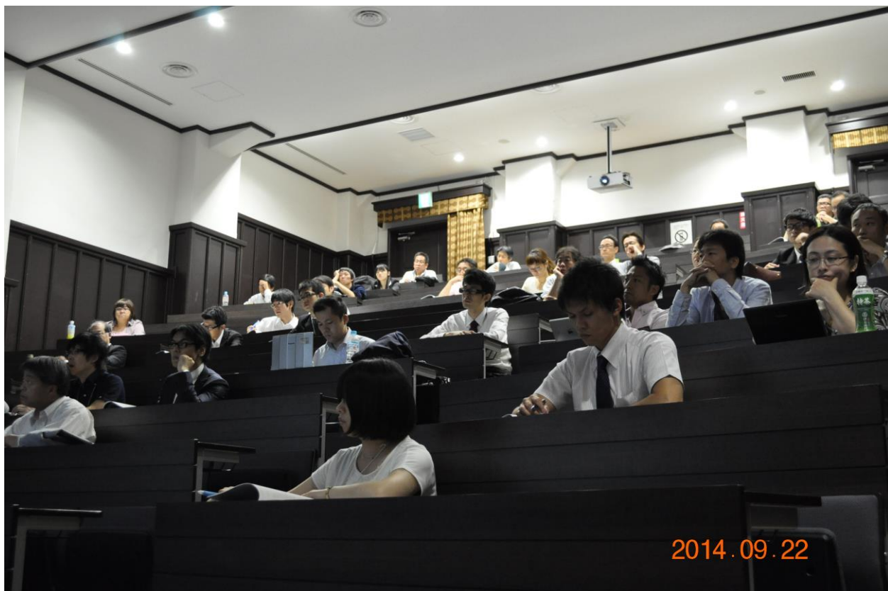
一般演題口演会場 (1)