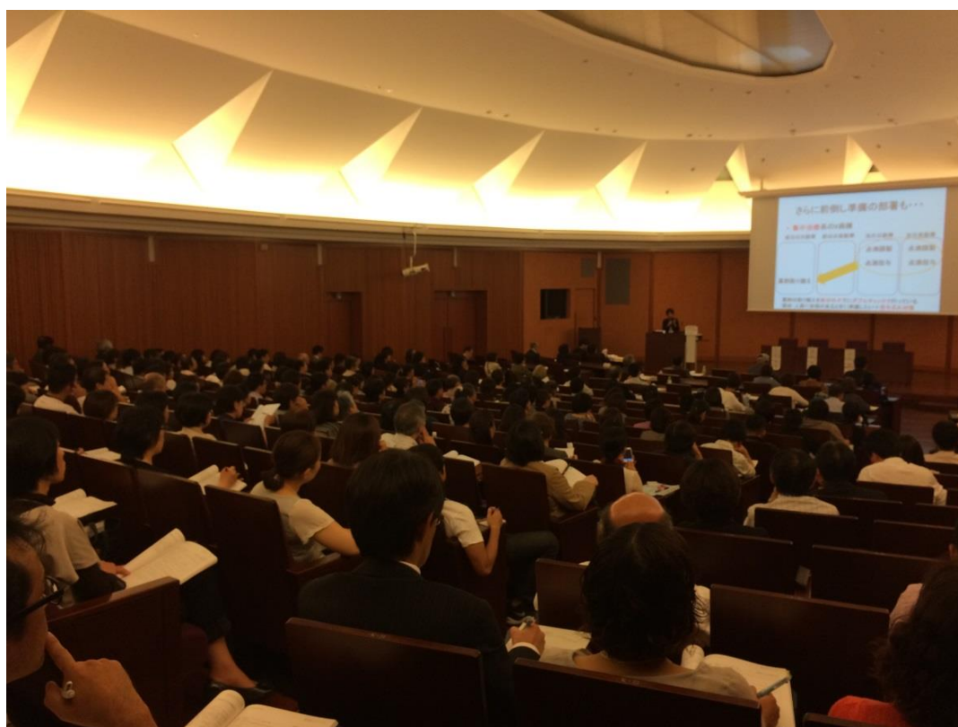
第 1 会場