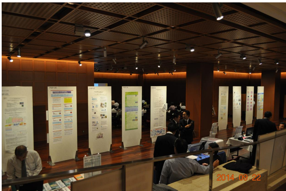
第 10 会場 (ポスター発表)