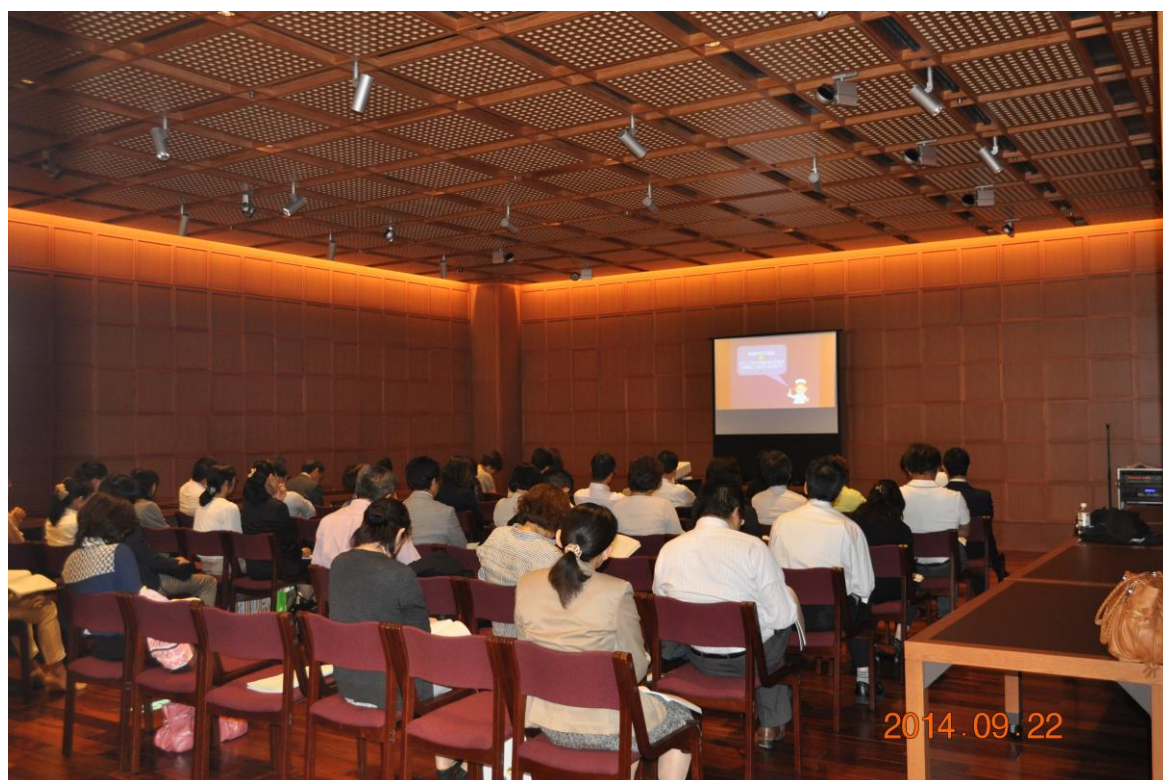
第1会場の隣接拡張会場(遠隔モニター使用)